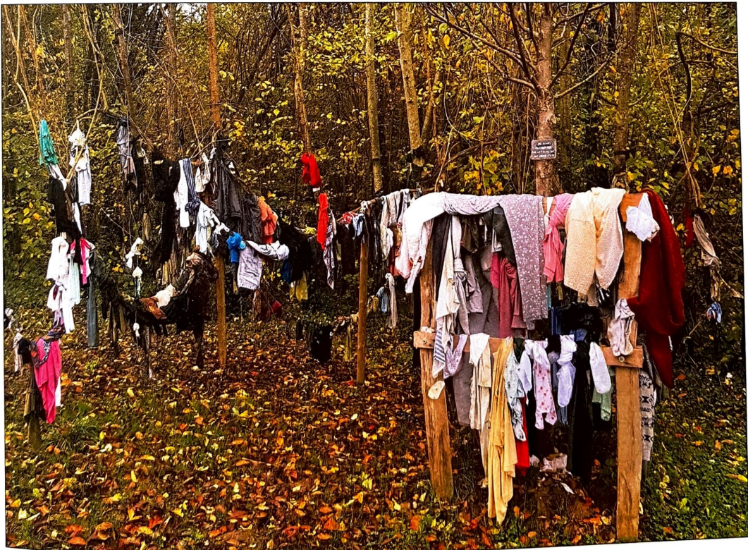
Culte des arbres... Ici l'arbre à loques à Senarpont, dans la Somme.