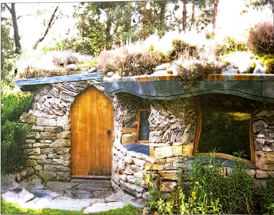
Findhorn... un refuge pour le confinement...

Les esprits liés à l'air sont les elfes, excellents archers qui aiment la musique et la beauté, ou encore les sylphes – sylphides, au féminin – qui règnent sur les vents et les tempêtes.